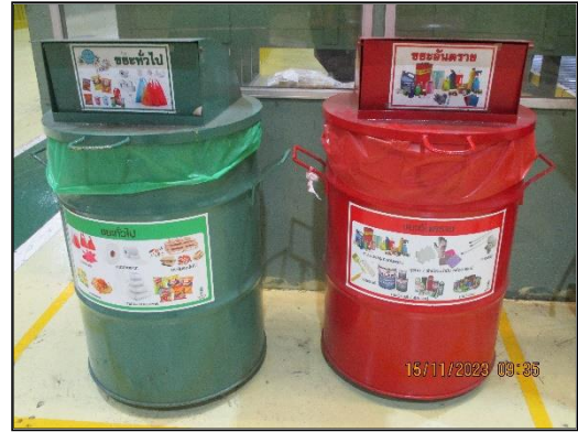
ภาพที่ 2.9 ถังขยะแยกประเภทภายในพื้นที่โครงการฯ