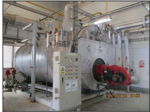
ภาพที่ 2.1 ปล่องระบายอากาศของหม้อผลิตไอน้ำ (Boiler Stack)