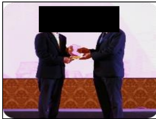
ได้รับรางวัลมาตรฐานความรับผิดชอบต่อผู้ประกอบการอุตสาหกรรมต่อสังคม (CSR-DIW) ประจำปี 2566 จากกรมโรงงานอุตสาหกรรม เมื่อวันที่ 13 กันยายน 2566