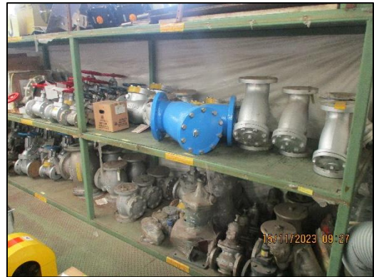
ภาพที่ 2.6 อะไหล่หรืออุปกรณ์เครื่องมือที่ใช้ในระบบบำบัดน้ำเสีย