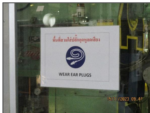
ภาพที่ 2.11 ป้ายเตือน/สัญลักษณ์บริเวณที่มีเสียงดังและให้สวมใส่อุปกรณ์ป้องกันอันตรายส่วนบุคคล