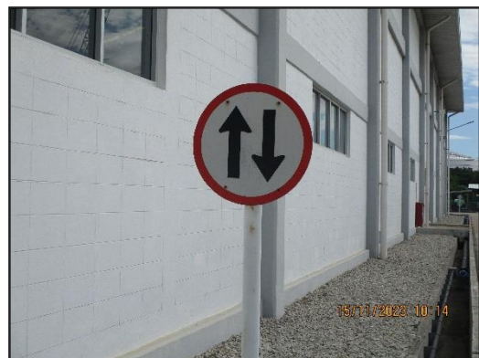
ภาพที่ 2.13 ป้ายบอกเส้นทาง จำกัดความเร็ว และสัญญาณจราจรภายในพื้นที่โครงการฯ