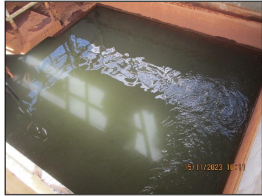
ภาพที่ 2.4 บ่อตรวจสอบคุณภาพน้ำ (Final Inspection Tank)