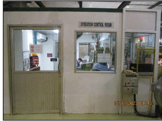
ภาพที่ 2.12 ห้องควบคุม (Control Room)