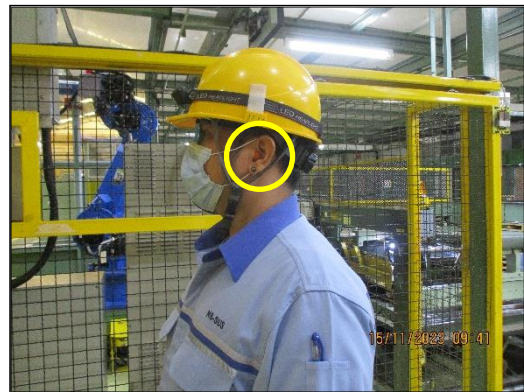
ภาพที่ 2.10 พนักงานสวมใส่อุปกรณ์ป้องกันอันตรายส่วนบุคคลขณะปฏิบัติงาน