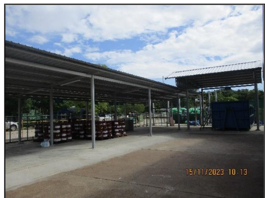
ภาพที่ 2.8 อาคารกองเก็บวัสดุที่ไม่ใช้แล้ว (Green Yard)