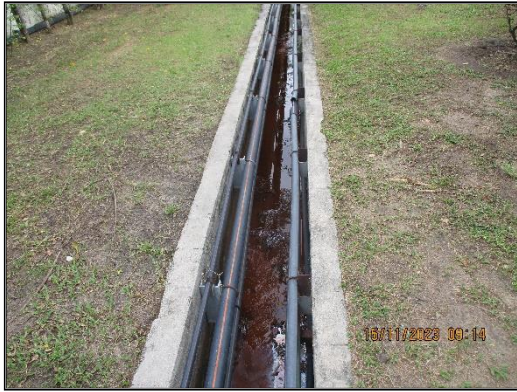
ภาพที่ 2.14 รางระบายน้ำฝนในพื้นที่โครงการฯ