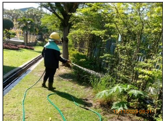
ภาพที่ 2.7 การรดน้ำต้นไม้