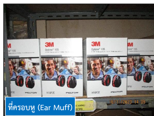
ภาพที่ 2.18 อุปกรณ์ป้องกันอันตรายส่วนบุคคลสำรองของโครงการฯ