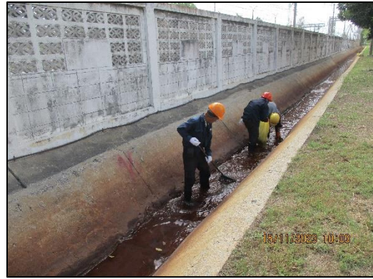
ภาพที่ 2.15 การทำความสะอาดรางระบายน้ำ