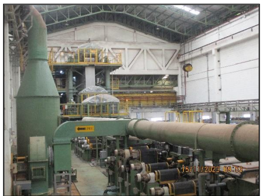
ภาพที่ 2.2 ปล่องระบายอากาศของระบบดักจับไอสารเคมี (Wet Scrubber)