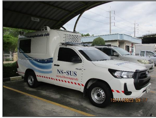
ภาพที่ 2.20 (ต่อ) ห้องพยาบาลเวชภัณฑ์ยาและรถฉุกเฉินของโครงการฯ