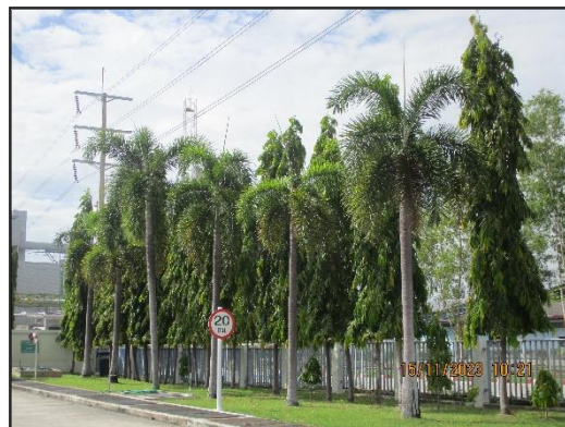
ภาพที่ 2.21 พื้นที่สีเขียวของโครงการฯ