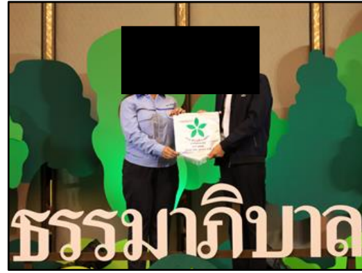
ได้รับรางวัล “ธงขาวดาวเขียว และธงขาวดาวทอง” ประจำปี 2566 เมื่อวันที่ 26 เมษายน 2566