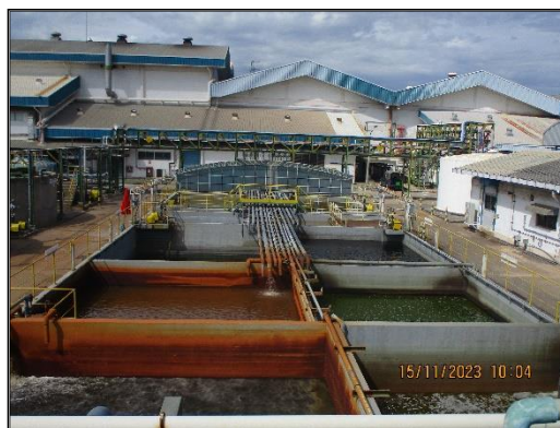
ภาพที่ 2.3 บ่อรวบรวมน้ำเสียของโครงการฯ