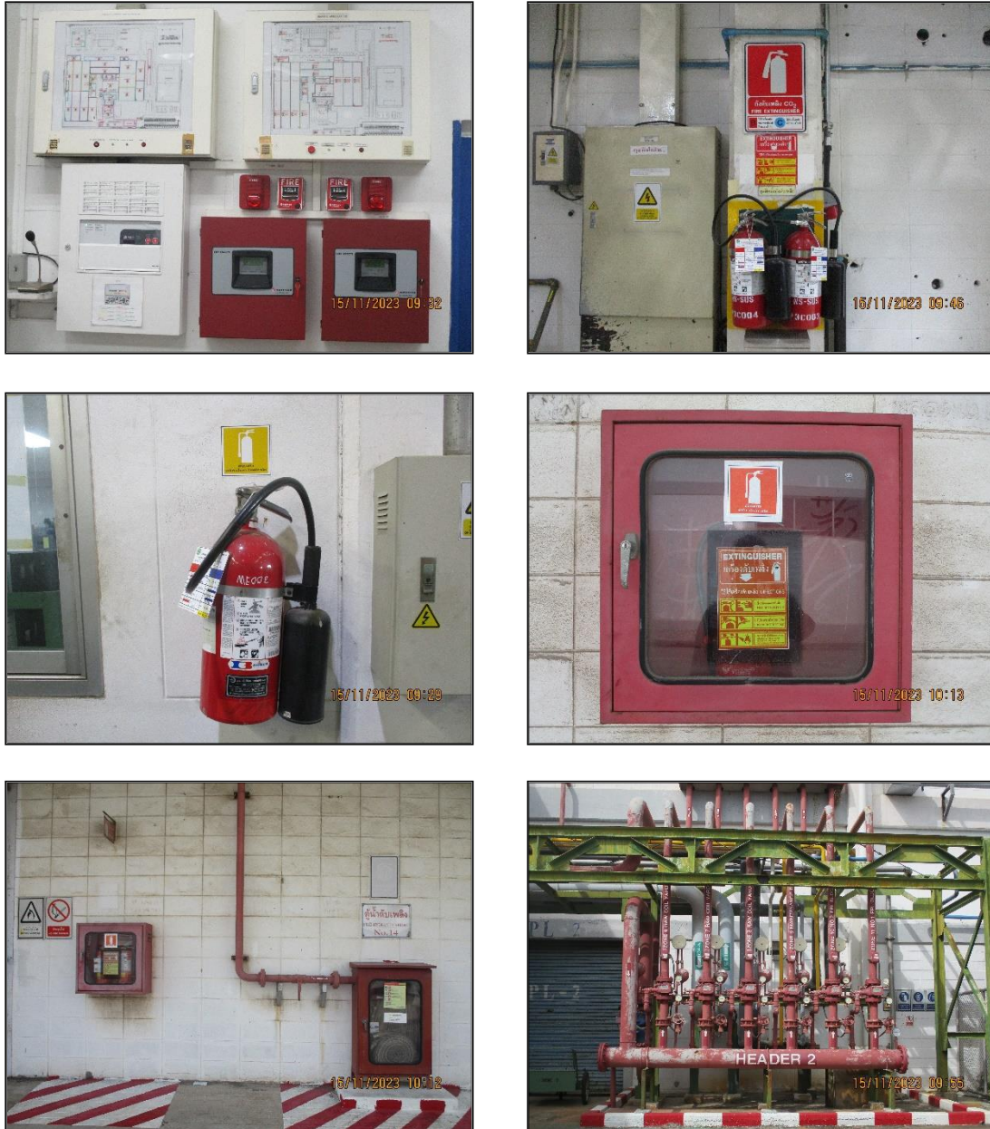
ภาพที่ 2.19 สัญญาณเตือนภัยและระบบดับเพลิงในพื้นที่โครงการฯ