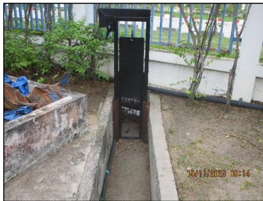
ภาพที่ 2.16 ประตูกั้นรางระบายน้ำฝนในพื้นที่โครงการฯ