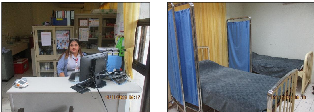
ภาพที่ 2.20 ห้องพยาบาลเวชภัณฑ์ยาและรถฉุกเฉินของโครงการฯ